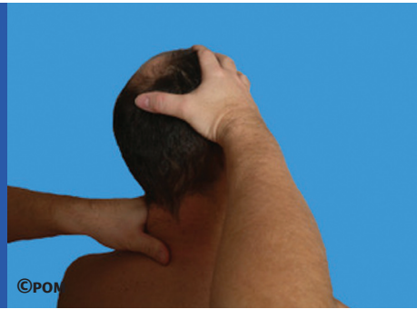
Figures 8.8 et 8.9 : Test impaction facettaire

Ce test n'est pas spécifique mais il permet de voir si l'extension-inclinaison de la tête en homolatérale est douloureuse.