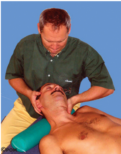
Figure 8.10 : Test de glissement : on sollicite l'ouverture facettaire par une position de flexion légère, inclinaison gauche et surtout une translation droite en direction du processus articulaire testé. Le test est à la fois un test de mobilité et un test de reproduction de la douleur. Il est non douloureux dans un syndrome d'impaction facettaire et soulage un conflit radiculaire arthrosique.

Ce test n'est pas spécifique mais il permet de voir si l'extension-inclinaison de la tête en homolatérale est douloureuse.